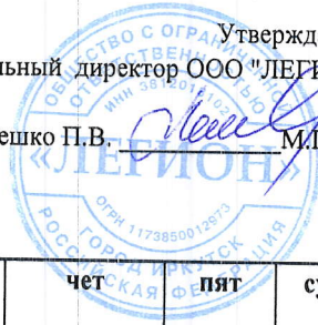
График оказания услуг по уборке лестничных клеток