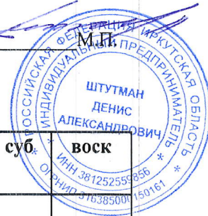
График оказания услуг по уборке лестничных клеток