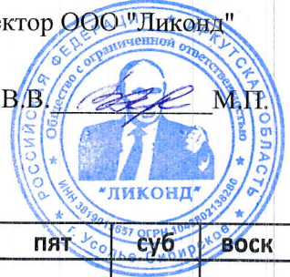
График оказания услуг по уборке лестничных клеток